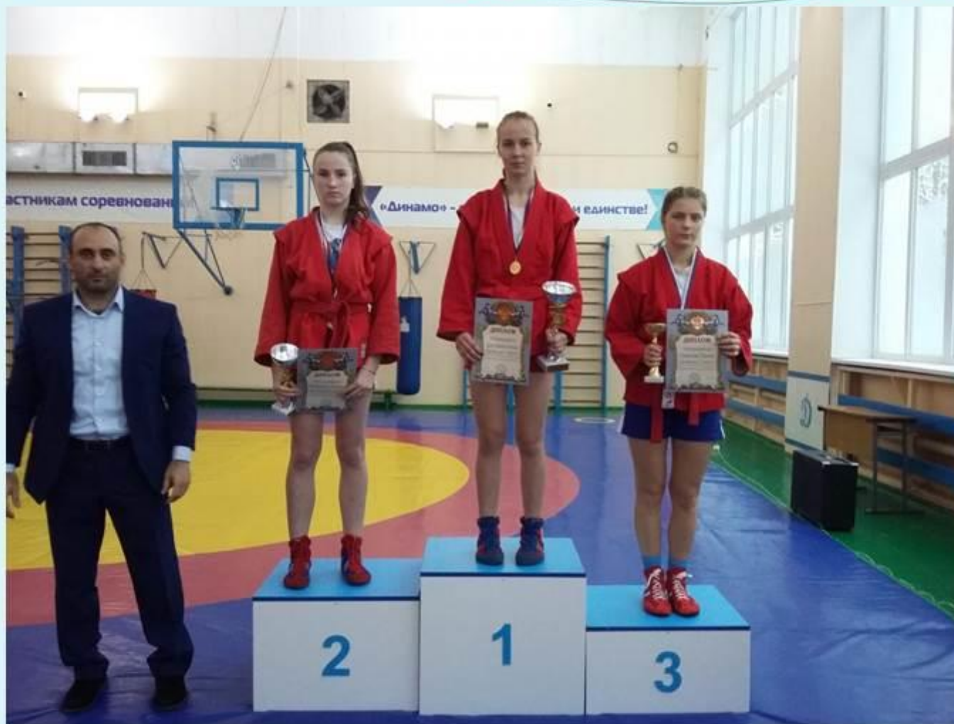
Первенство Тульской области по борьбе самбо среди девушек 2000-2001 г.р.