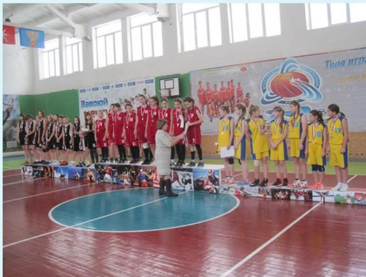
Межрегиональный турнир «Золотая осень» по баскетболу среди команд девушек Г. Плавск