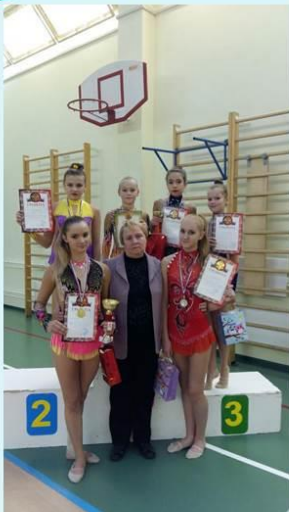
Турнир по художественной гимнастике «Счастливое детство» г. Москва