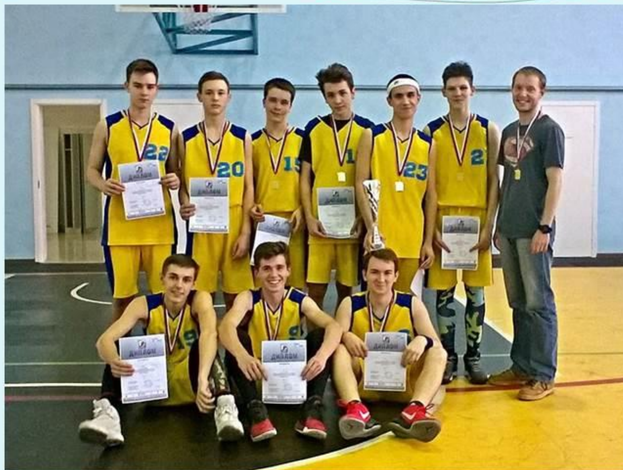
Дивизиональный этап ШБЛ «КЭС-баскет» г. Киреевск