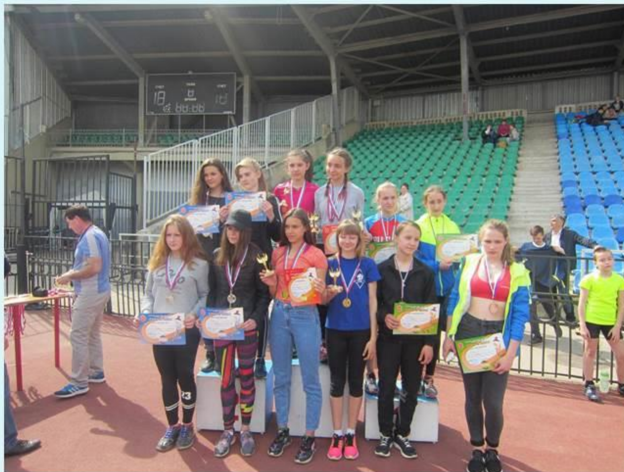
Первенство и Чемпионат Тульской области по легкой атлетике среди юношей и девушек 2002-2003 г. р., 2004-2005 г. р.