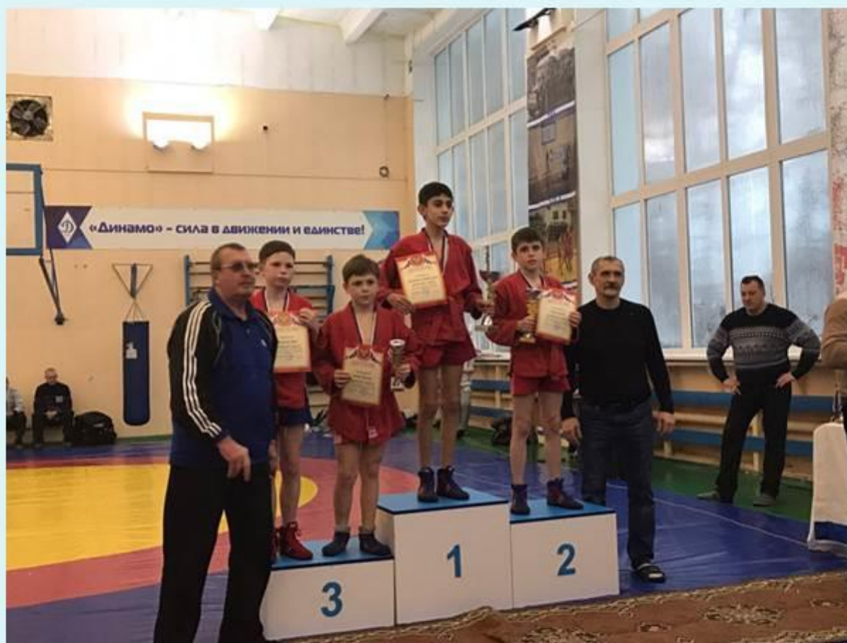
Первенство Тульской области по борьбе самбо среди юношей 2003-2004 г.р.