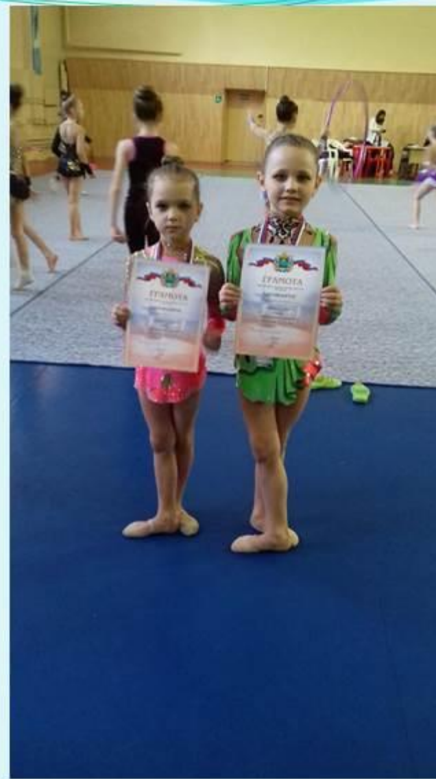
Первенство МБОУ ДОД ДЮСШ «Луч» в г. Калуга по художественной гимнастике