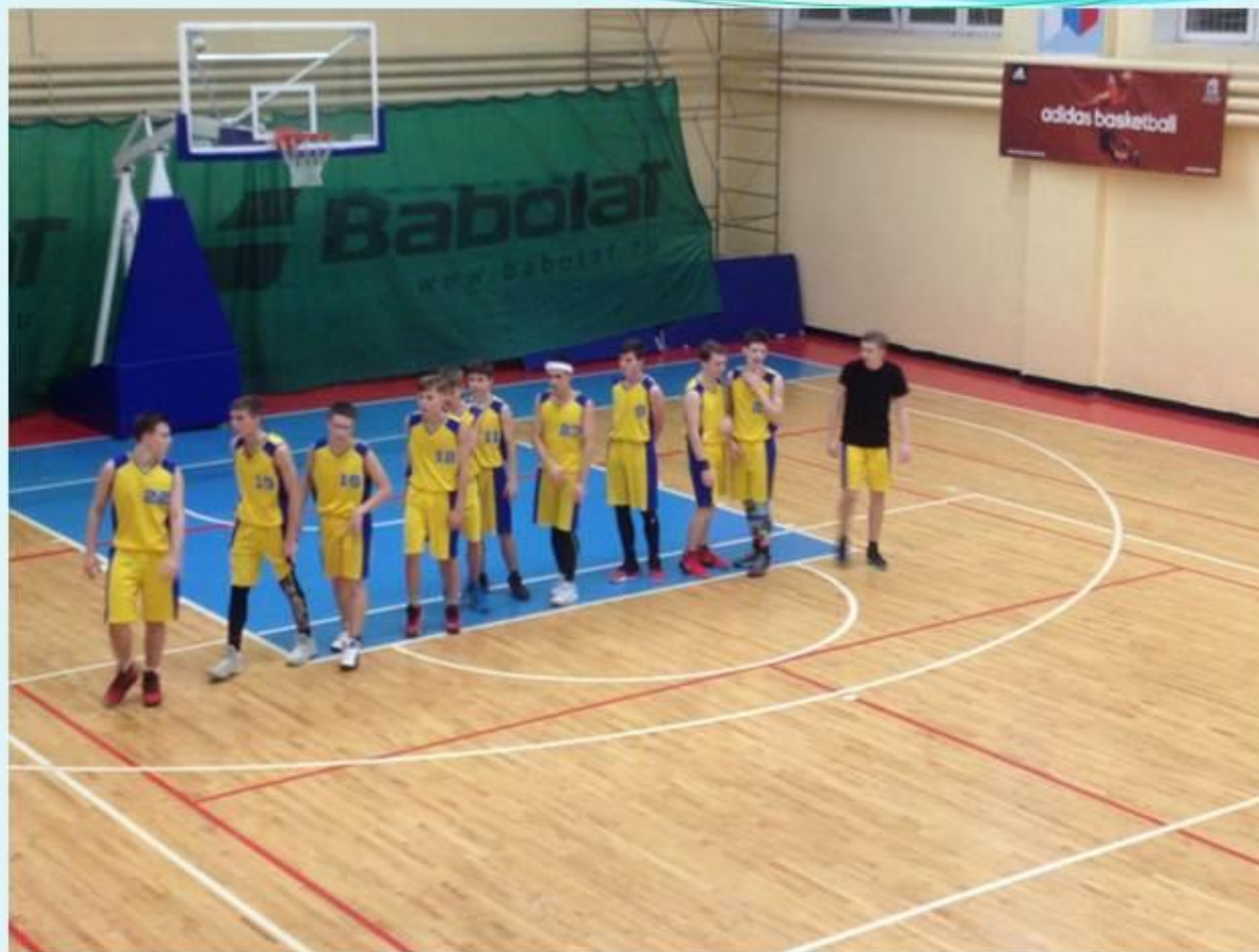
Первенство Тульской области по баскетболу среди команд юношей 1999 г.р. и моложе