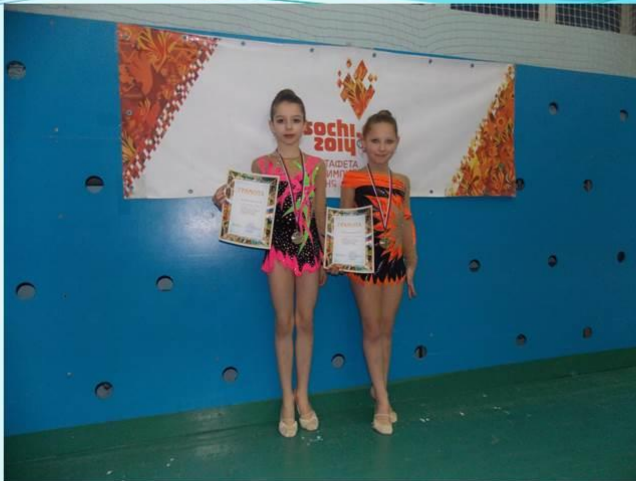
Межрегиональный турнир по художественной гимнастике «Новогодняя сказка» г. Новомосковск