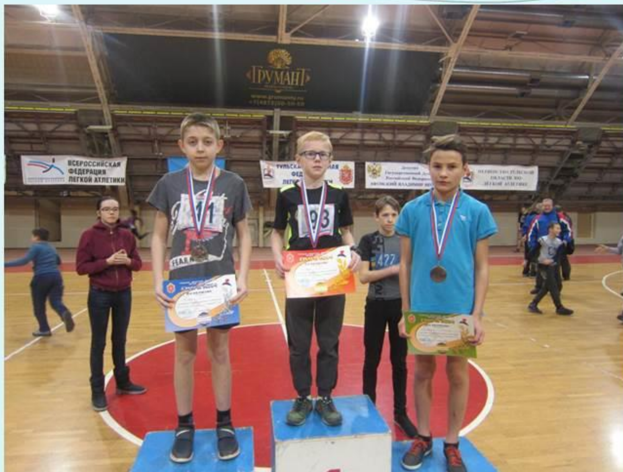
Первенство тульской области по легкой атлетике