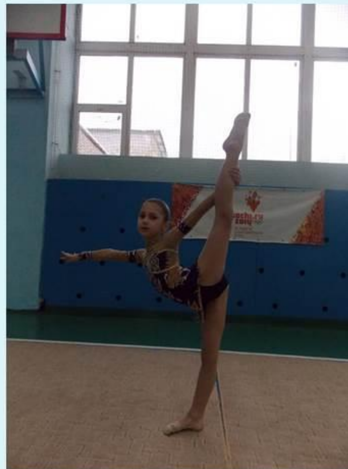
Межрегиональный турнир по художественной гимнастике "Новогодняя сказка" г. Новомосковск