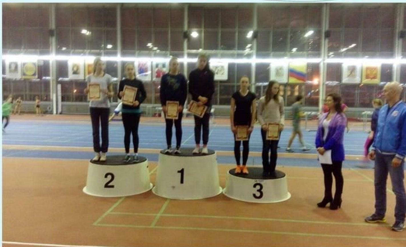
Первенство школы олимпийского резерва им. братьев Знаменских "Юность Москвы"