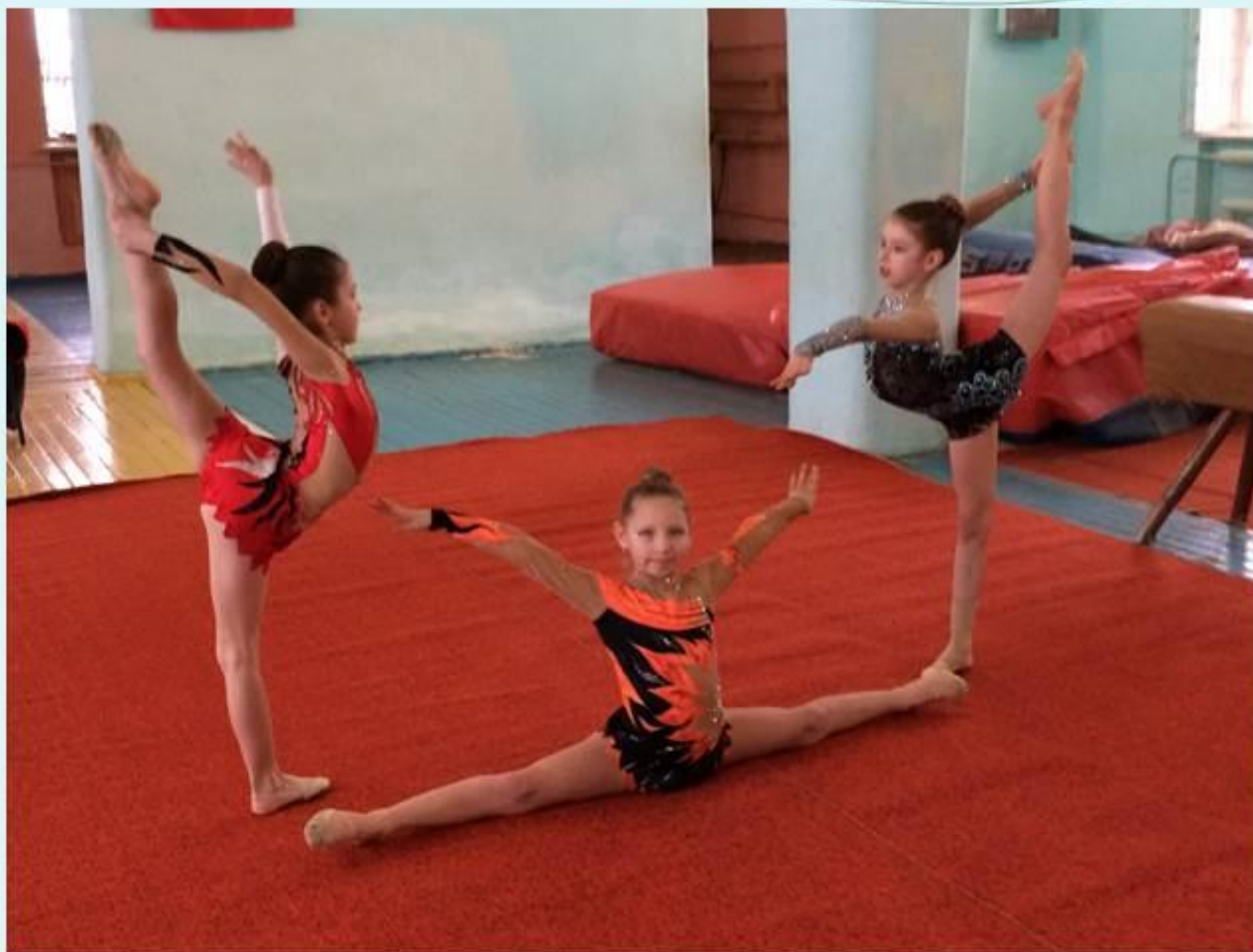
Первенство МБУ ДО «ДЮСШ №1» по художественной гимнастике