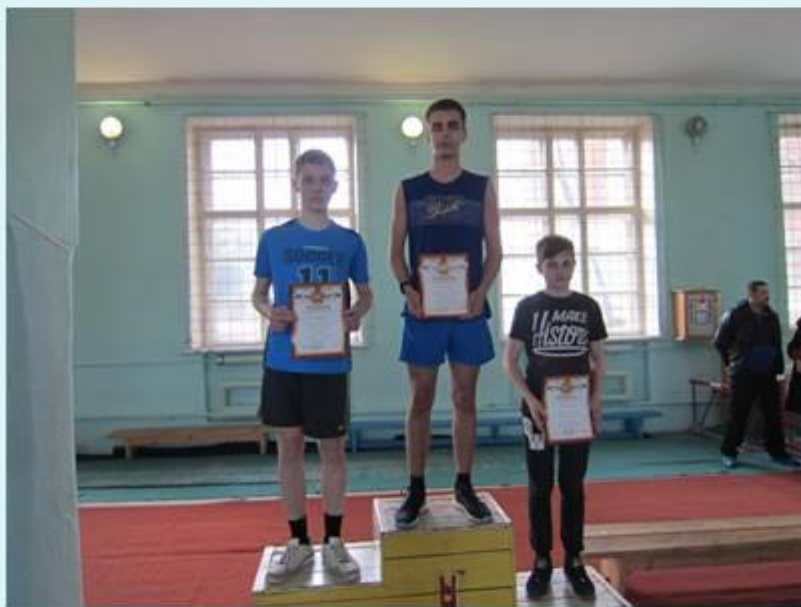
Первенство МБУ ДО "ДЮСШ №1« по легкой атлетике средний и старший возраст