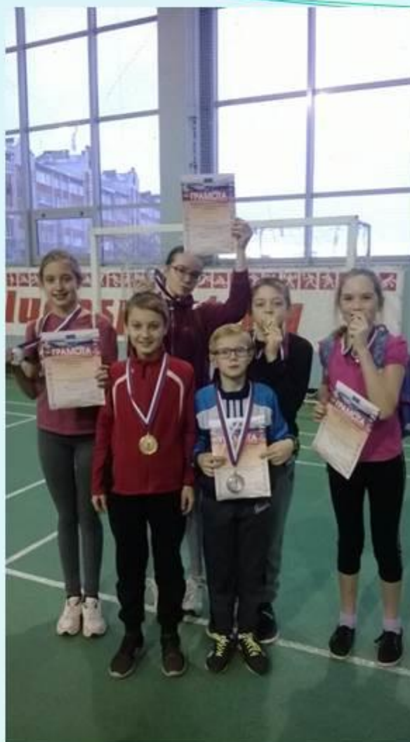
Открытое первенство г. Калуги по прыжкам в высоту «Новогодние рекорды»