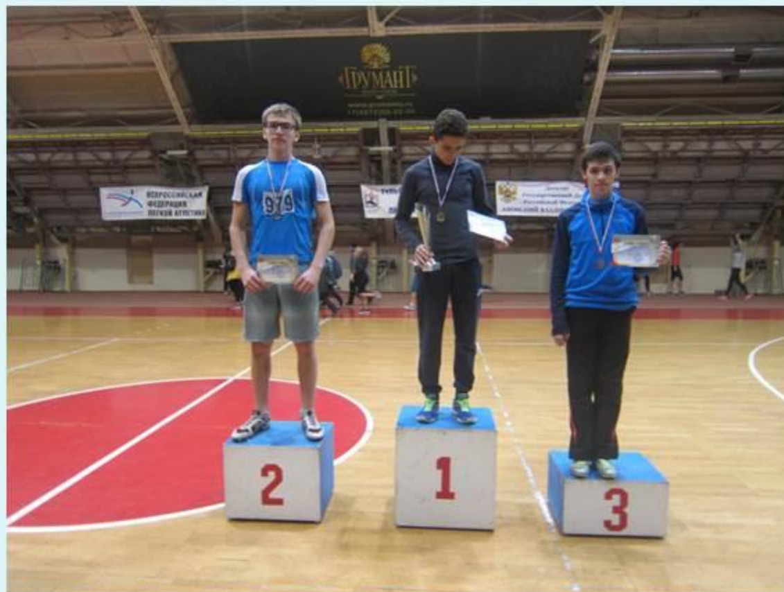
Открытое первенство МБУДО «СДЮСШОР» ЛЕГКАЯ АТЛЕТИКА г. Тула