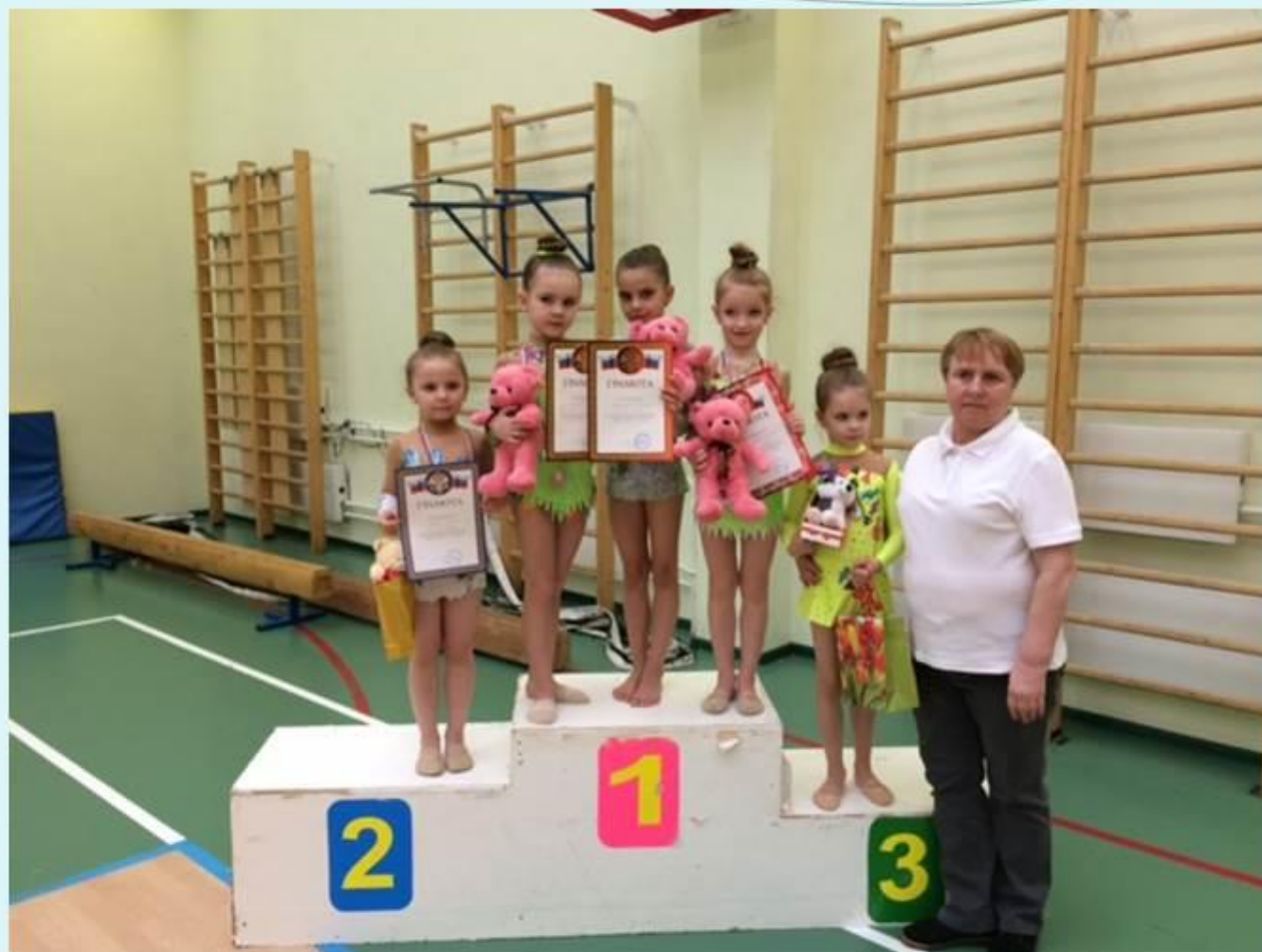
Турнир по художественной гимнастике «Подснежники», г. Москва