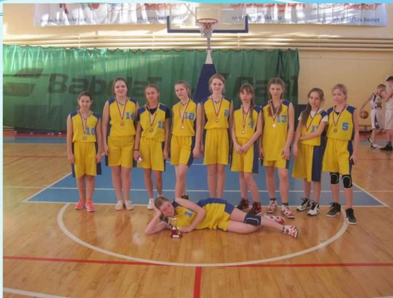
Первенство Тульской области по баскетболу среди команд девушек и юношей 2003 г.р.