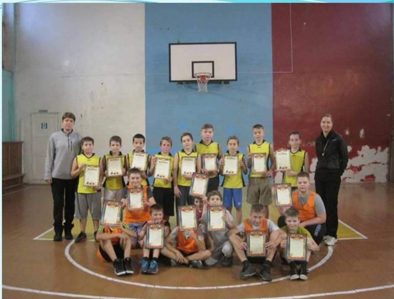
Первенство МБУ ДО "ДЮСШ №1" по баскетболу среди мальчиков 5-6 классов