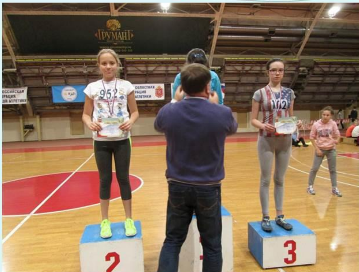
Первенство СДЮСШОР по легкой атлетике г. Тула