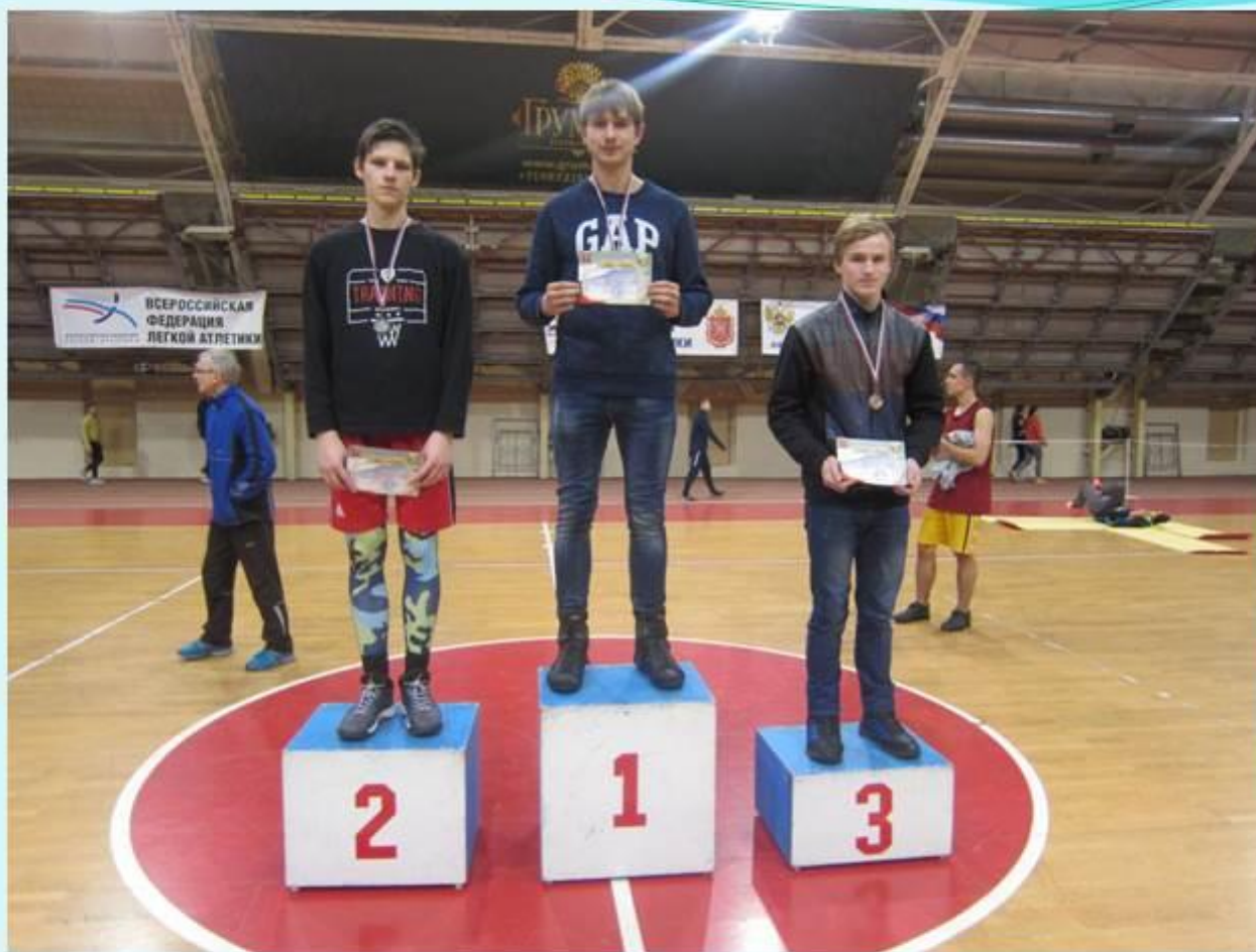
Первенство СДЮСШОР по легкой атлетике г. Тула