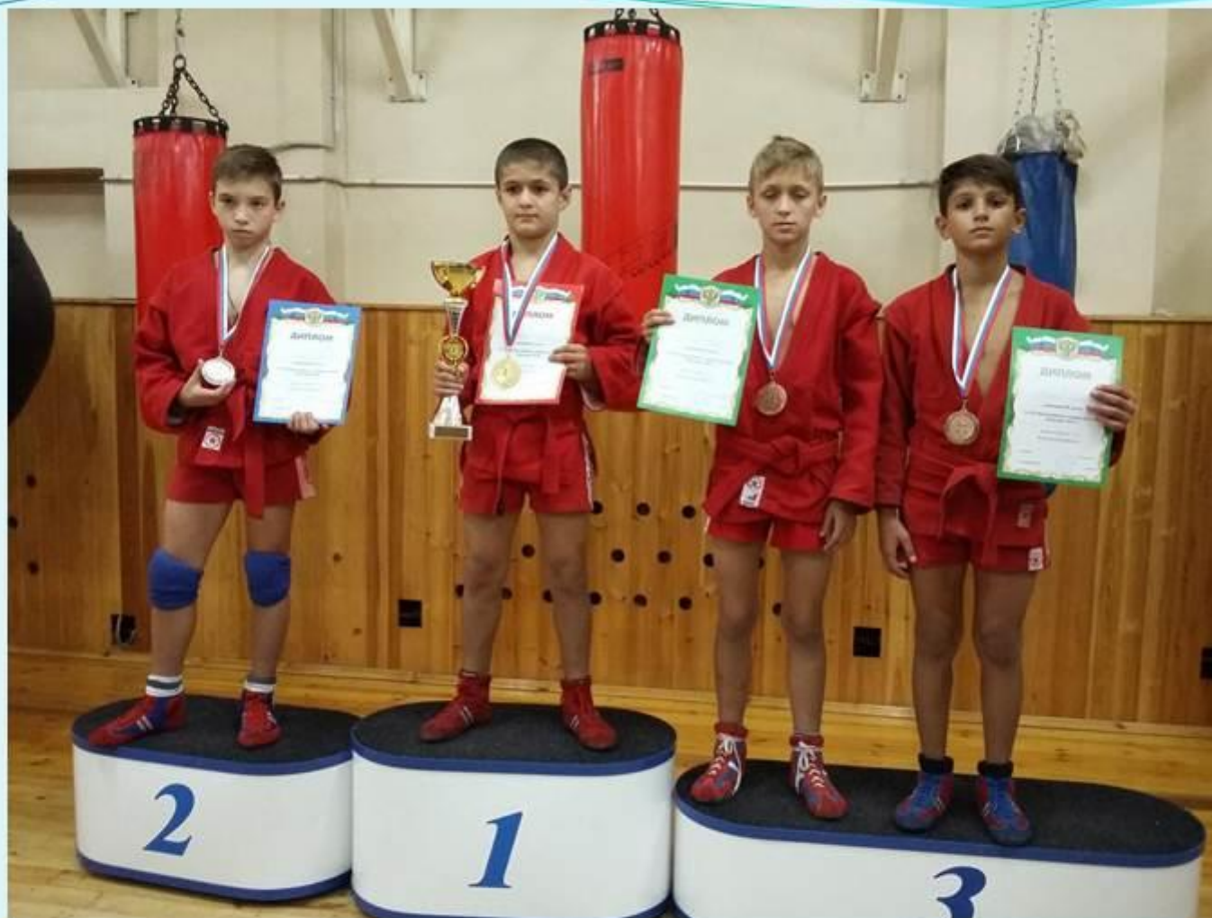
XXI Всероссийский турнир по самбо среди юношей и девушек "Бородино - 2016" Г. Можайск