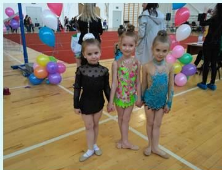
Традиционный турнир городов России по художественной гимнастике "Окские зори"